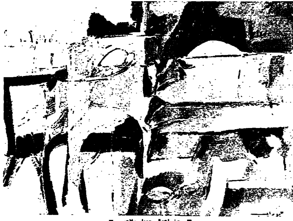
من اعمال جميل ملابح

وجه حلم الفنان الذي يرسم الرد الحياتي للموت البهيم المكلف، ولا احد يريد اصداء الحرب الا الرزيمة التي ابدأ عرض للرد على الازمات عبر الرسوم وتغير عن المعاناة من موقعها التشكيلي.